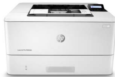
HP LaserJet Pro M404dn

Dynamic-Security-fähiger Drucker. Ausschließlich für die Verwendung mit Patronen mit Original HP Chip vorgesehen. Patronen mit Chips anderer Hersteller funktionieren möglicherweise nicht oder in Zukunft nicht mehr. Weitere Informationen unter: