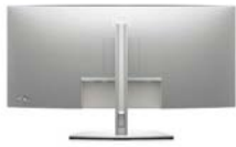
Steuerung per Joystick, Steckplatz für Kabelführung

Zweckmäßiges Design, für ergonomischen Komfort konzipiert.