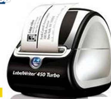
LabelWriter 450 Turbo