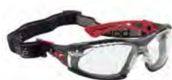
RUSHPFSPSI (Rush+ Klar mit Schaumstoff und Kopfband)