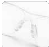
Rutschfester und einstellbare Nasensteg