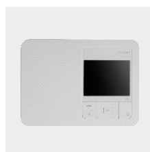
Canon SELPHY CP1500