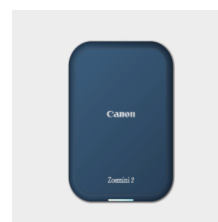
Canon Zoemini 2