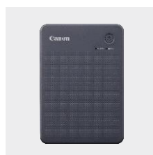
Canon SELPHY QX20