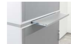
Zusätzlicher Auszugsboden V1727