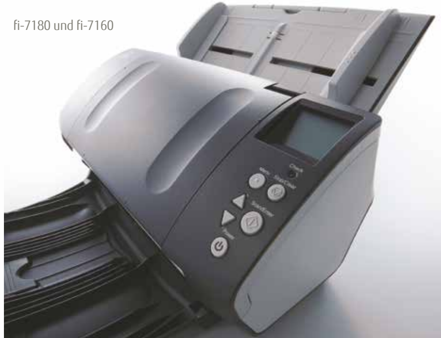
fi-7180 und fi-7160