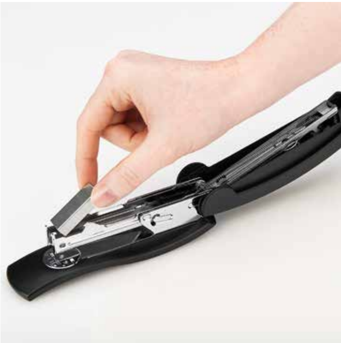
Nach Hochklappen des Oberteils können die Klammern in das Gerät eingelegt werden.