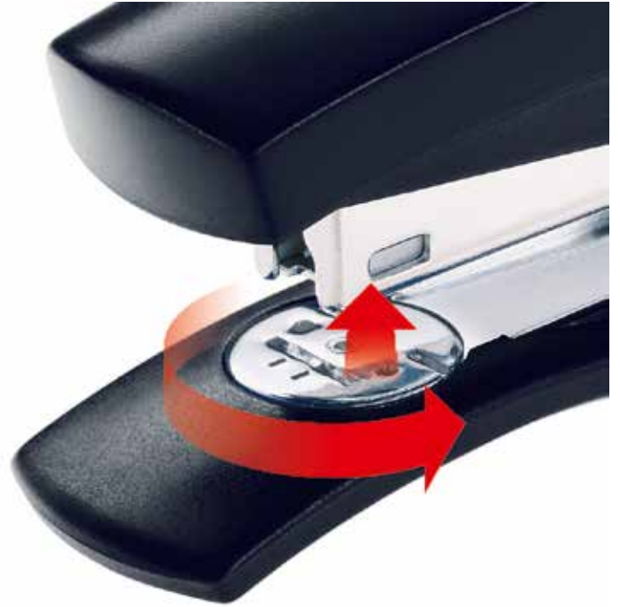
Wendematrize für die offene und geschlossene Heftung sowie Möglichkeit zum Nageln