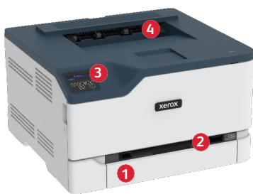
Xerox® C230 Farbdrucker