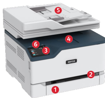
Xerox® C235 Multifunktions-Farbdrucker