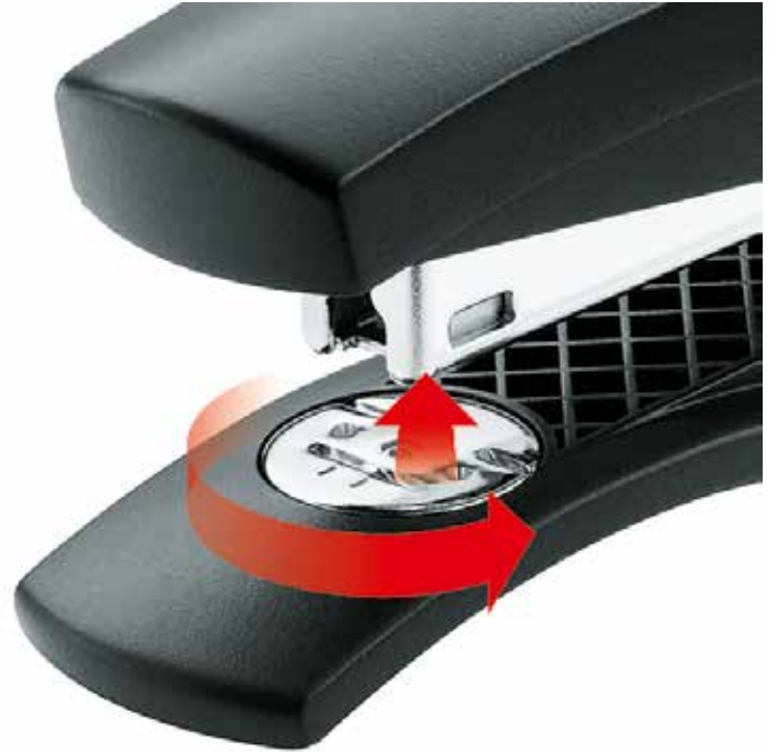
Wendematrize für die offene und geschlossene Heftung