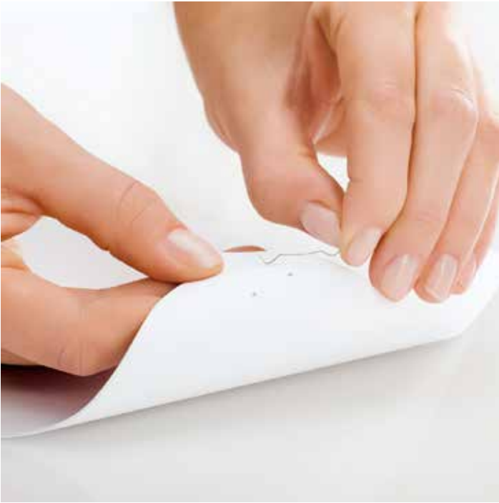
Einfaches und schnelles Entfernen der Klammer bei der offenen Heftung.