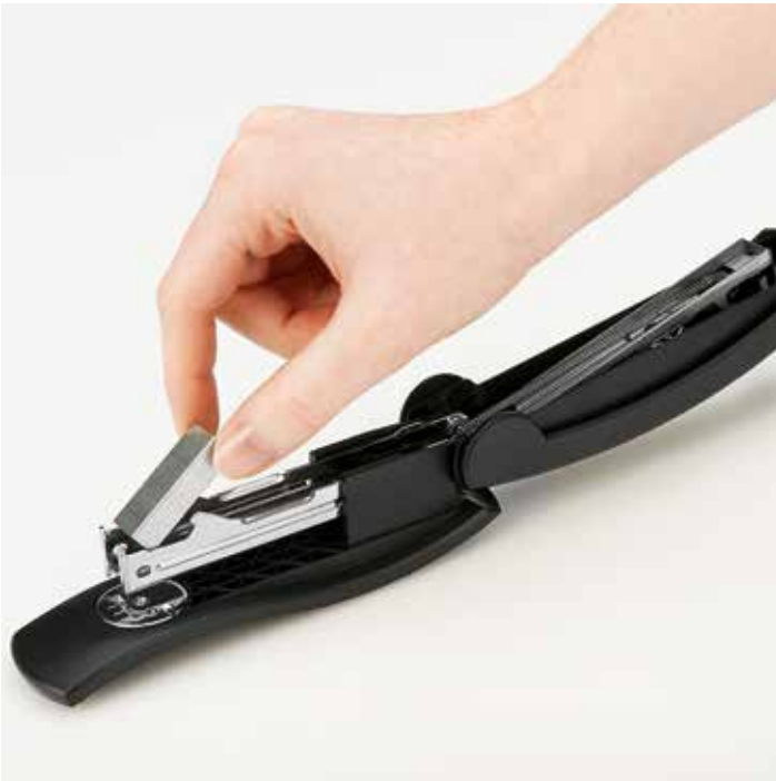
Nach Hochklappen des Oberteils können die Klammern in das Gerät eingelegt werden.