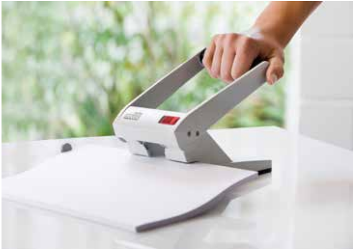
Komfortgriff für müheloses Lochen durch eine perfekte Kraftübertragung