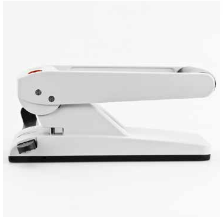
Oberteilverriegelung für eine Platz sparende Aufbewahrung