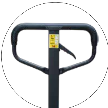
stabile Deichsel mit Gummi-Kunststoffummantelung

(+/- 0,3 %) Vier in den Gabeln eingebaute Wiegezellen sorgen auch bei ungünstigen Lastenlagen oder Bodenverhältnissen für ein präzises Wiegen.