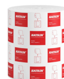
58198 Katrin System Handtuchrolle M 2-lagig