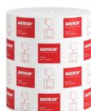
460102 Katrin System Handtuchrolle M 2-lagig