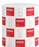
460232 Katrin System Handtuchrolle L 2-lagig

Beispielhafte Auswahl aus allen Ländern. Die Verfügbarkeit für einzelne Regionen finden Sie auf der Webseite.