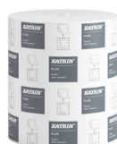
460058 Katrin Plus System Handtuchrolle M 445 Blatt 2-lagig