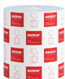
460263 Katrin System Handtuchrolle M 2-lagig, Blau