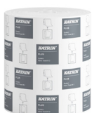
82537 Katrin Plus System Handtuchrolle