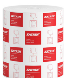
460201 Katrin System Handtuchrolle M 1-lagig