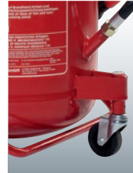
Lenkrolle und Standbügel