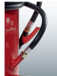
Dreh- und abstellbare Löschpistole