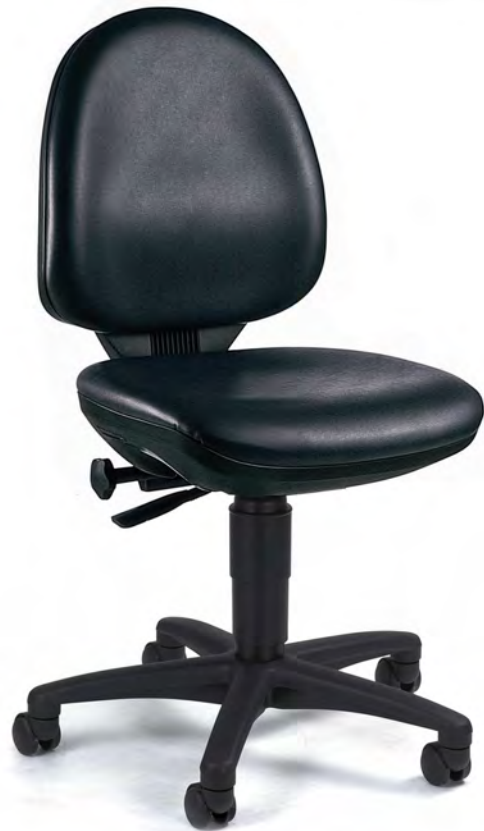
Abb. in Ausführung 72250 D10