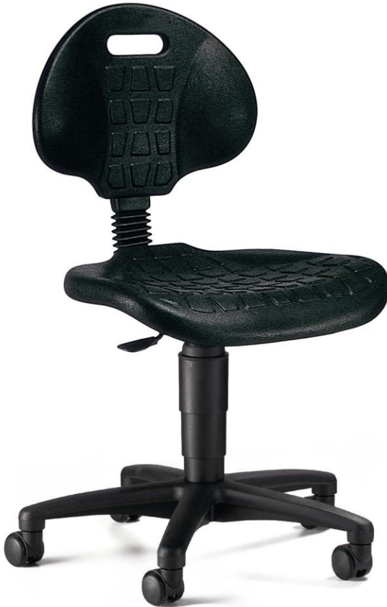
Abb. in Ausführung 72220 PU0