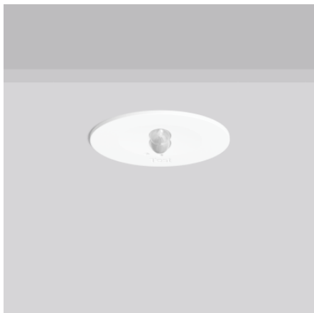
Deckeneinbauleuchten 4051859804642 D 50, H 4