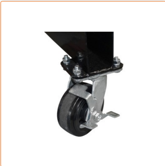
Lenkrollen mit Feststellbremse