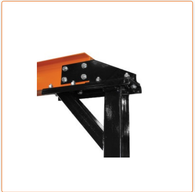
Stabile Bauweise der Trägerstützen