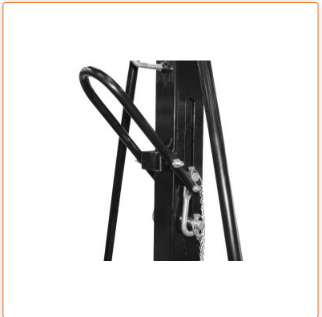
Einfache und sichere Höhenverstellung über Hebel und zwei Sicherungsbolzen