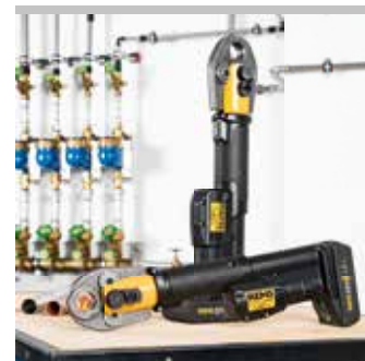
Tested by electrosuisse >>>