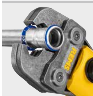
REMS Presszange (PZ-2B)