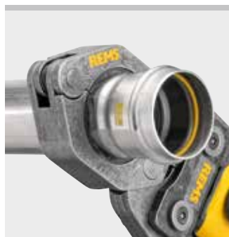
REMS Pressring (PR-2B)