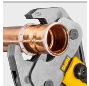
REMS Presszange (PZ-4G)