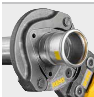
REMS Pressring (PR-3S)