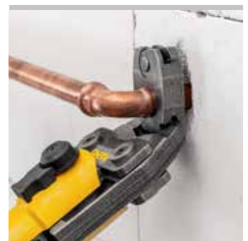
REMS Pressring S (PR-2B), stufenlos schwenkbar