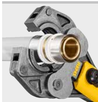
REMS Presszange (PZ-S)