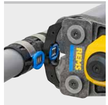
REMS Presszange GFF