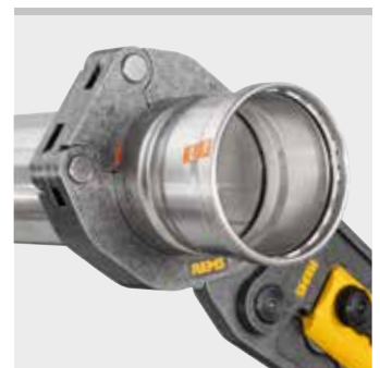
REMS Pressring (PR-3B)