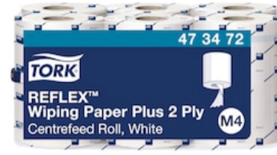
Tork Reflex Starke Mehrzweck Papierw. M4 473472