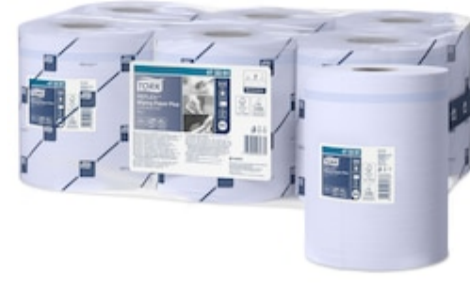
Tork Reflex Wip Pap Plus Blue M4 473391