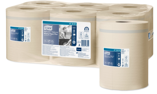
Tork Reflex Natural Wiping Paper Plus 473481