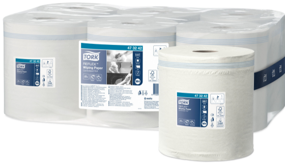
Tork Reflex Mehrzweck Papierwisch. M4 473242