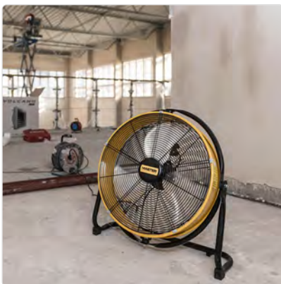
Master DF 20 auf der Baustelle