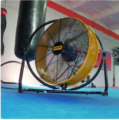
Master DF 20 Turnhalle