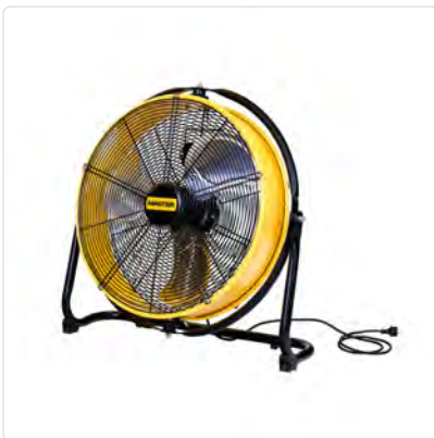
Master DF 20 – professionelle Lüfter