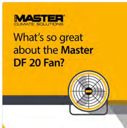
Master DF 20 Ventilator leistungsstark langlebig vielseitig