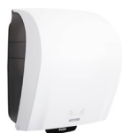
40735 Katrin System