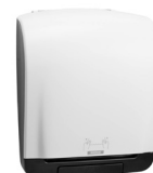
90045 Katrin System