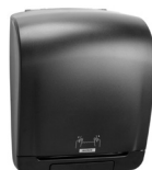
92025 Katrin System