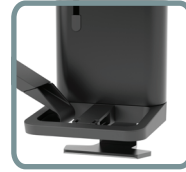
FLACHE TISCHKLEMME 98-490-224 (MATT-SCHWARZ)