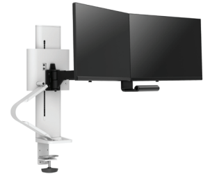
TRACE Dual Monitorhalterung mit Tischklemme