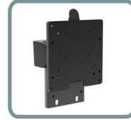
VON DUAL- AUF EINZELSCHIRMLÖSUNG 47-109-224 (MATT-SCHWARZ)