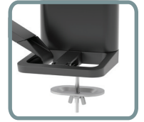
BEFESTIGUNG FÜR TISCHBOHRUNG 98-492-009 (MATT-SCHWARZ)