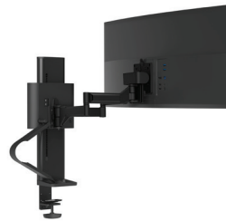
TRACE Monitorhalterung mit Tischklemme