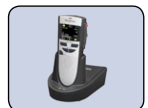
Mit Digta Station (auch als WLAN oder LAN-Station)