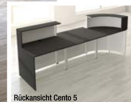
Rückansicht Cento 5