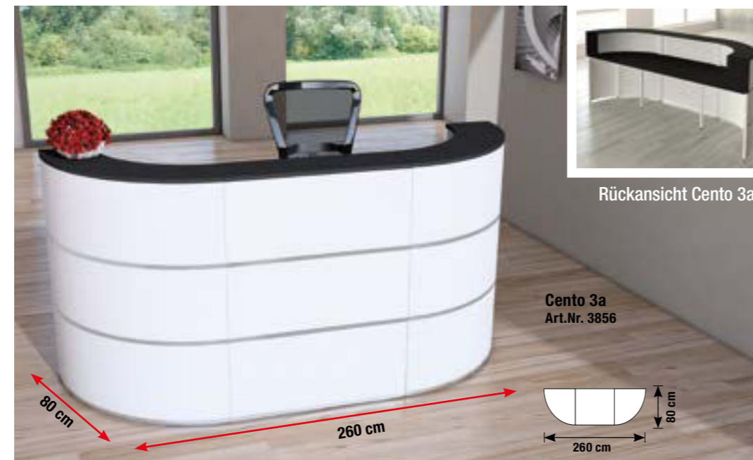
Rückansicht Cento 3a