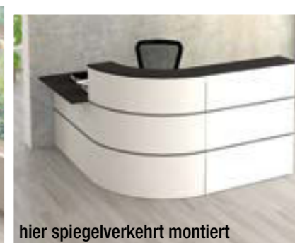
hier spiegelverkehrt montiert