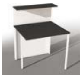
Erweiterungs-Element Maß: 100 x 80 x 110 Art. 3860

Die Cento-Theken lassen sich durch ein Erweiterungselement beliebig verlängern. Das Element ist 110 cm lang und kann sowohl an dem rechten wie auch an dem linken Ende einer Theke angebaut werden.