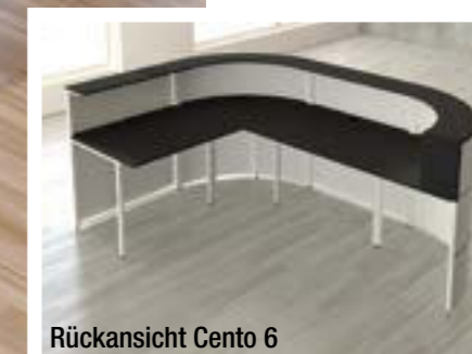
Rückansicht Cento 6

WEITERE INFOS erhalten Sie auf unserer Homepage unter DOWNLOADS