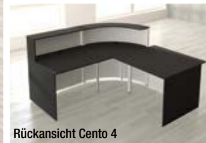
Rückansicht Cento 4