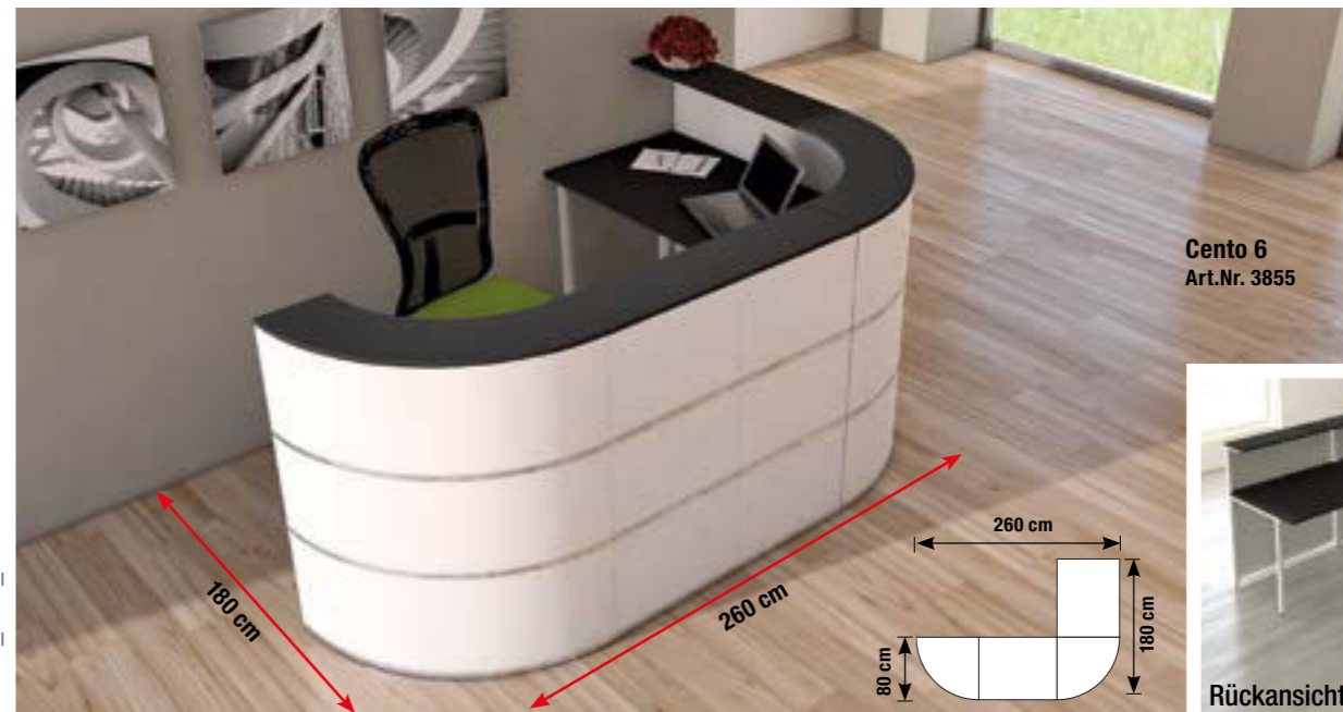
Cento 6 Art.Nr. 3855