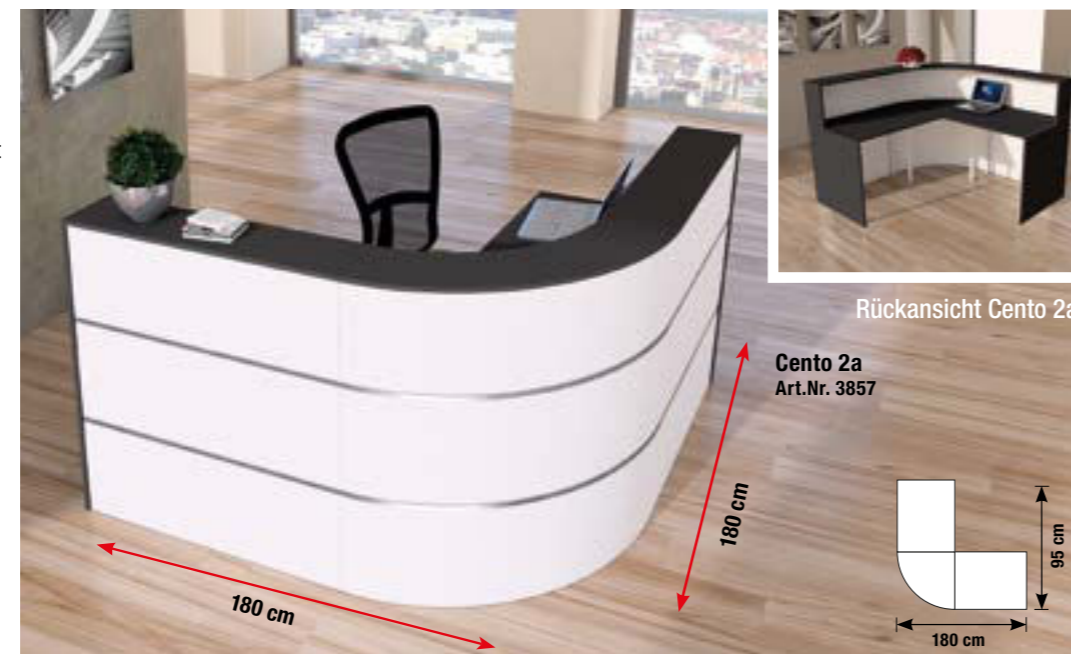
Rückansicht Cento 2a