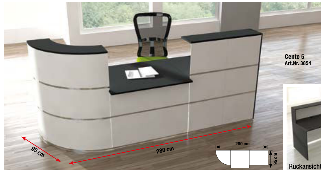
Cento 5 Art.Nr. 3854