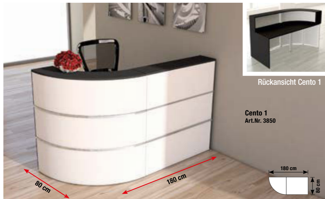
Rückansicht Cento 1

Die Theke Cento ist eine Stahl-/Holzkonstruktion. Hinter den 110 cm hohen Fronten befindet sich ein vollwertiger Arbeitsplatz mit einer Tiefe von 80 cm und einer Höhe von 74 cm. Die Holzplatten sind mit Melaminharz beschichtet und mit einer stoßfesten ABS-Kante versehen. Für die Kabelführung gibt es Durchlässe in den Arbeitsplatten. Der Theken-Metallkörper ist mit dekorativen Edelstahlstreifen bestückt.