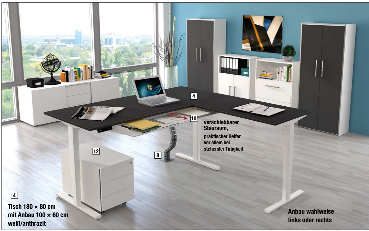
Tisch 180 x 80 cm mit Anbau 100 x 60 cm weiß/anthrazit

verschiebbarer Stauraum, praktischer Helfer vor allem bei stehender Tätigkeit