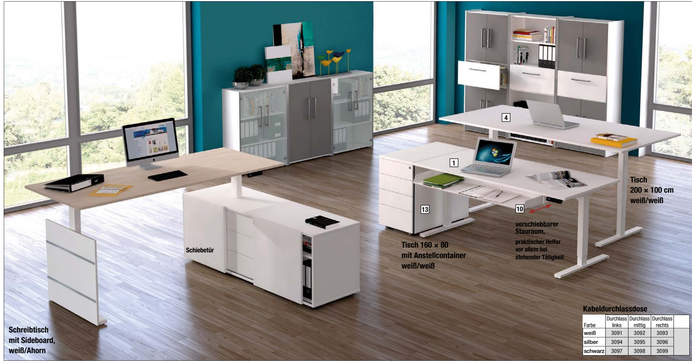
Schreibtisch mit Sideboard, weiß/Ahorn