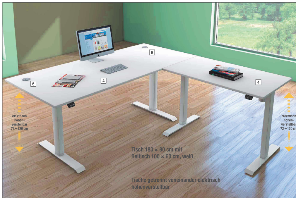
Tisch 180 x 80 cm mit Beitisch 100 x 60 cm, weiß

WEITERE INFOS erhalten Sie auf unserer Homepage unter DOWNLOADS