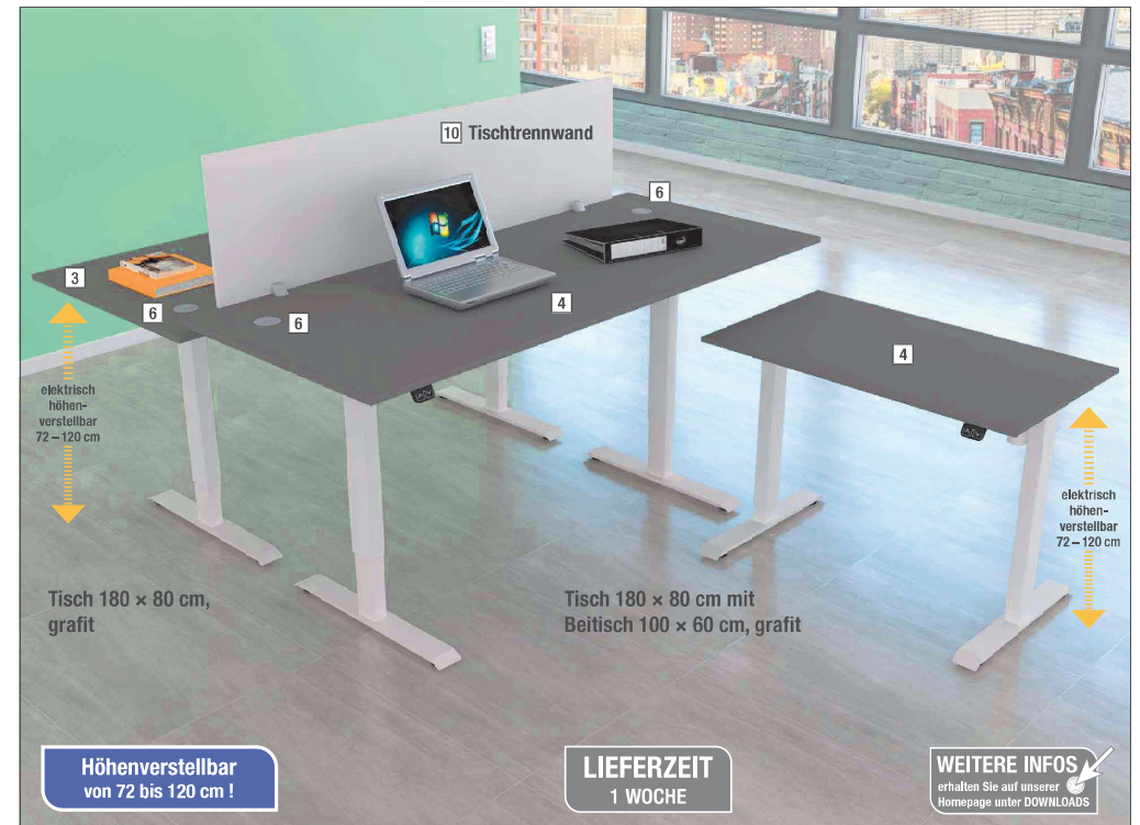
Tisch 180 x 80 cm, grafit