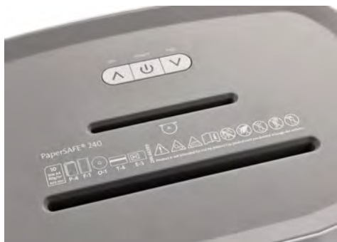
Dahle Aktenvernichter PaperSAFE® 240