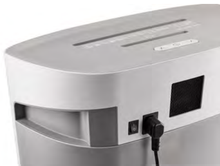
Dahle Aktenvernichter PaperSAFE® 240