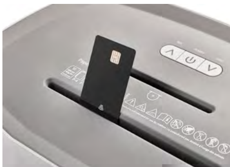
Dahle Aktenvernichter PaperSAFE® 240