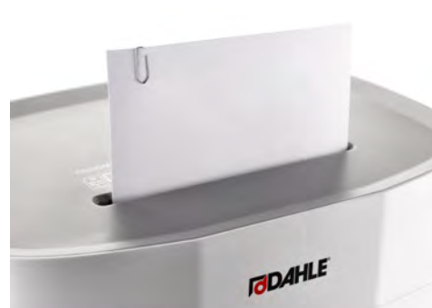
Dahle Aktenvernichter PaperSAFE® 240