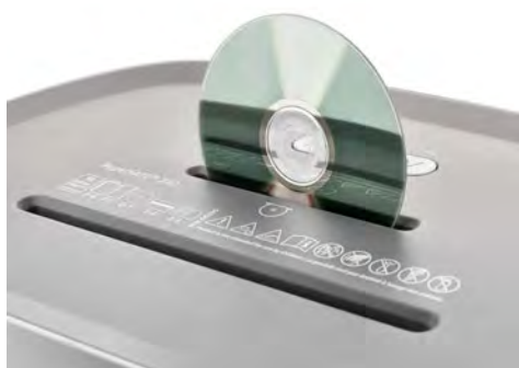
Dahle Aktenvernichter PaperSAFE® 240