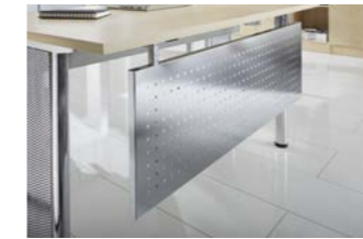
Nicht für Serien: H, Q, J, R

Zur Montage an den Schreibtischen (Bohrungen vorhanden) Metall, gelocht, pulverbeschichtet Abstand zur Unterkante Tischplatte ca. 5 cm Blende 35 cm hoch Kann nicht mit Kabelwanne KW montiert werden