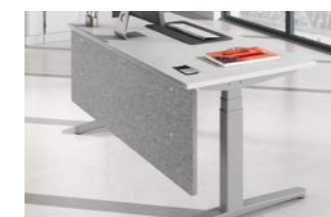
Nicht für: H, J, Q, R

mit Halterung Höhe 50 cm, 2,5 cm dick, Schallschutzvlies, grau-meliert, Filzoptik Schwer entflammbar gemäß DIN 4102 (B1) Schallschutzklasse C 1 cm Spalt zwischen Tischplatte und Knieraumblende