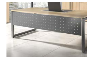
Nicht für: H, J, Q

Zur Montage an den Schreibtischen (Bohrungen vorhanden) Metall, gelocht, pulverbeschichtet Blende 35 cm hoch (36 cm mit Halterung) Kann nicht mit Kabelwanne KW montiert werden