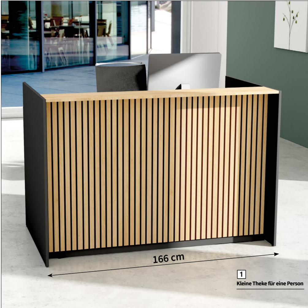
1 Kleine Theke für eine Person