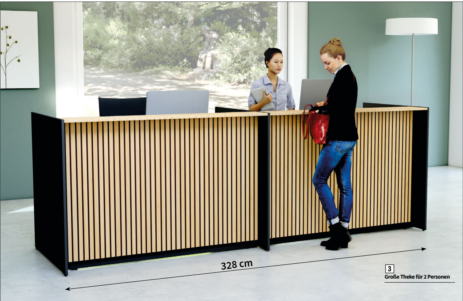
3 Große Theke für 2 Personen