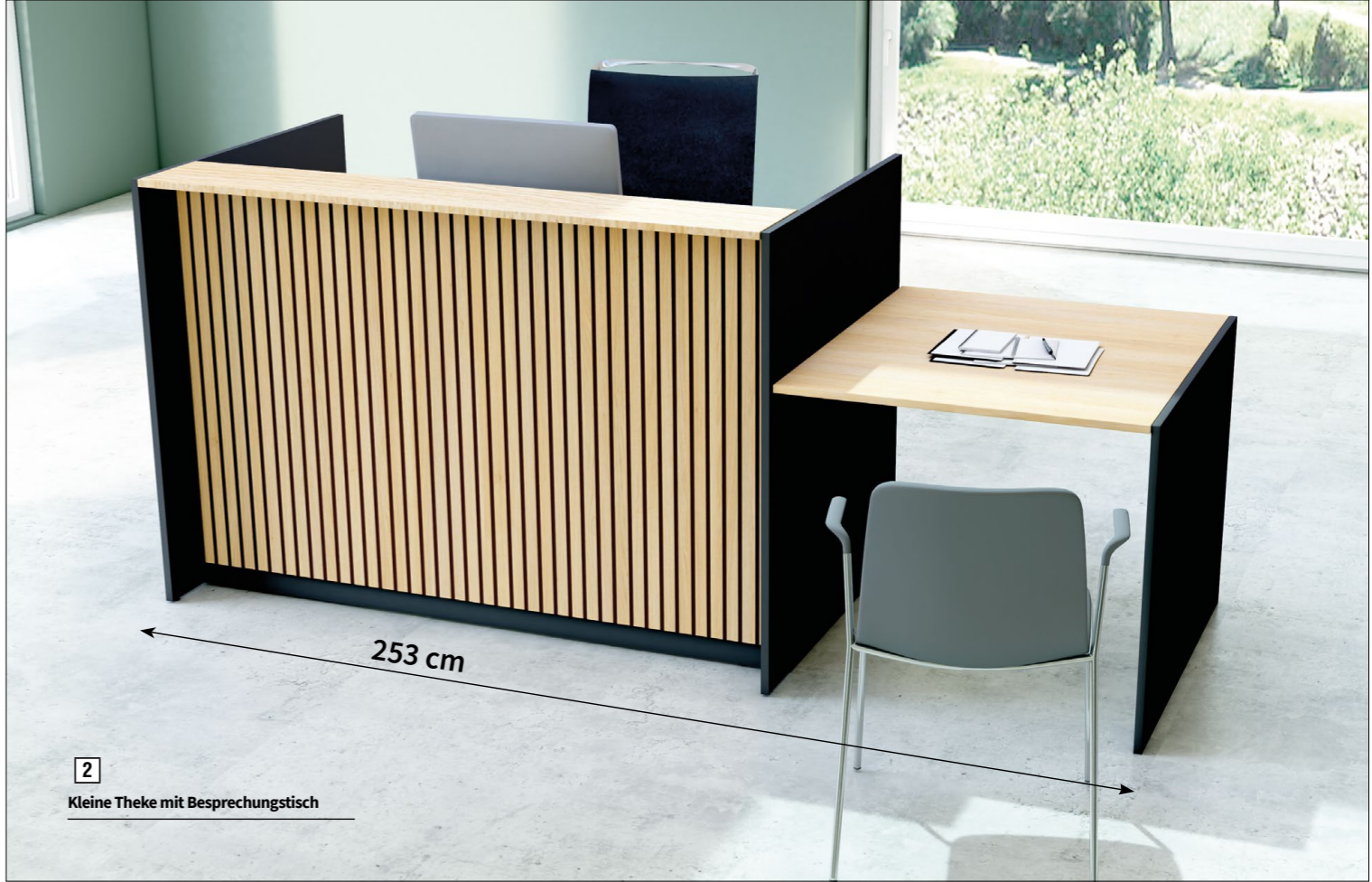
2 Kleine Theke mit Besprechungstisch