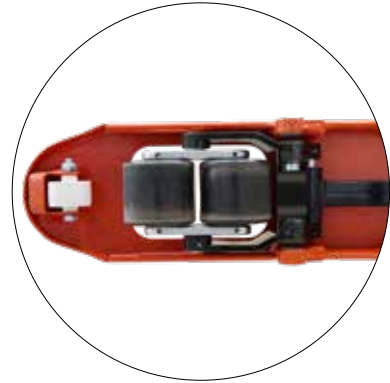
Ein- und Ausfuhrrollen