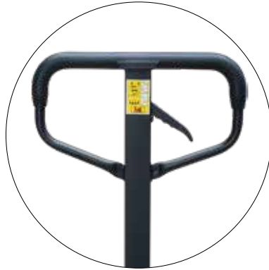
stabile Deichsel mit Gummi-Kunststoffummantelung