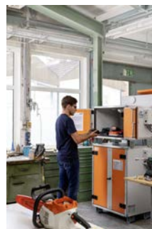
Produkt 12111 (8/5) und 12118 (8/10) Akkuschrack-Kombination K 8/17