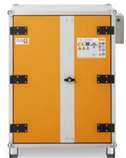
Produkt Frontansicht geschlossen