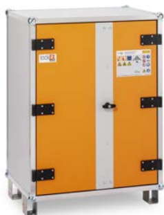
Produkt schräg von links geschlossen