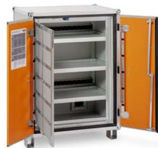
Produkt schräg von links offen