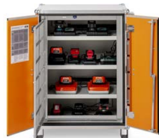
Produkt Frontansicht offen mit beispielhaftem Inhalt bzw. mit Zubehör (nicht im Lieferumfang enthalten)