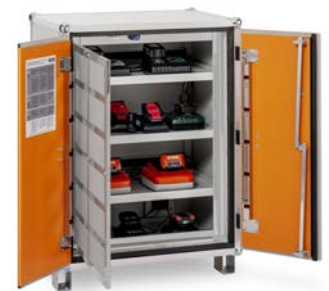
Produkt schräg von links offen mit beispielhaftem Inhalt bzw. mit Zubehör (nicht im Lieferumfang enthalten)