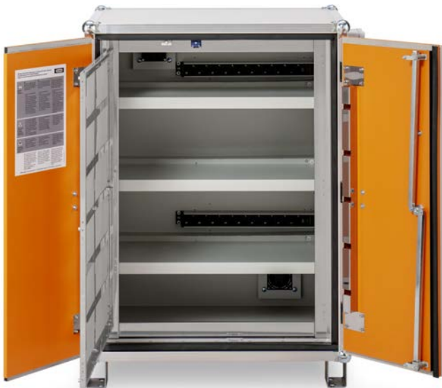
Produkt Frontansicht offen