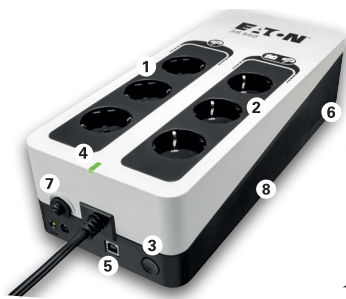
Eaton 3S 550 DIN