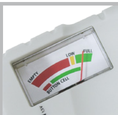
Leicht ablesbare, 3-farbige Skala