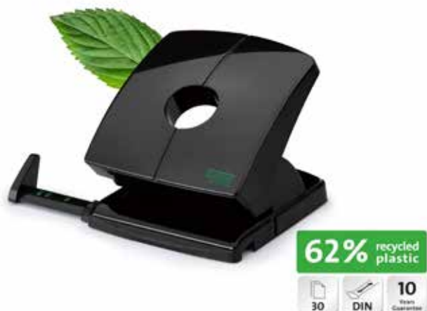
Novus B 230 re+new mit Piktogrammen