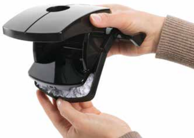
Der geteilt aufklappbare Locherboden bietet hohen Komfort beim Entleeren des Gerätes.