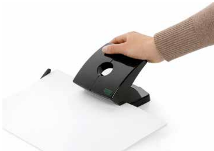
Schnell und einfach Lochen mit den Novus Bürolochern.