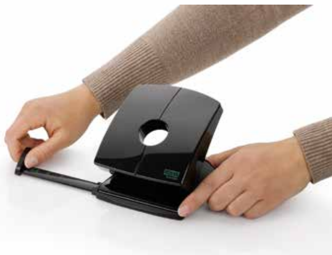
Sicher einrastende Anschlagschiene mit gut ablesbarer Formatanzeige