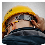
Einfach zu einzustellen

Dank dem Einstellrädchen am Hinterkopf lässt sich der Helm leicht anziehen oder lockern.