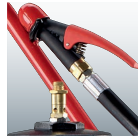
Dreh- und abstellbare Löschpistole