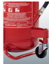
Lenkrolle und Standbügel